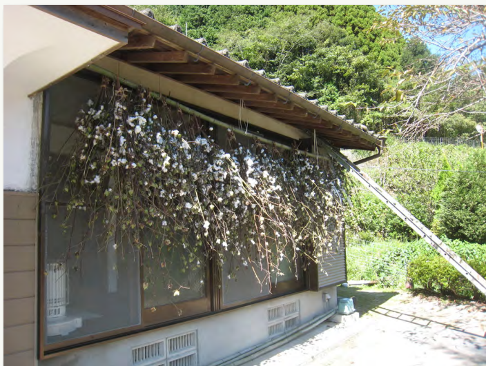
13. 公民館での陰干し