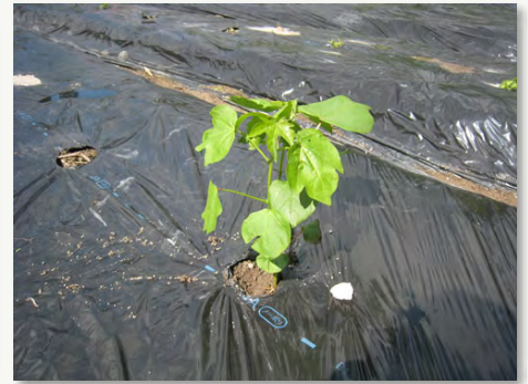
6. 根切り虫に負けず (6/16)