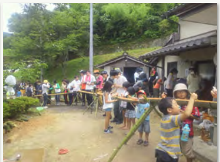
番外 作業後のそうめん流し (7/14)