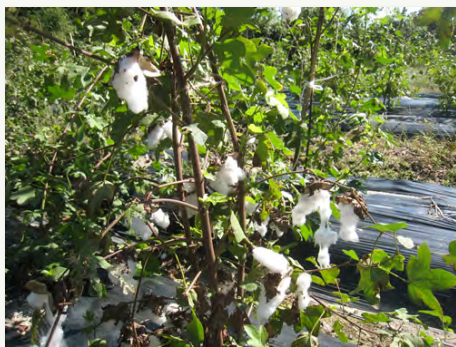
10. きれいに実った和綿