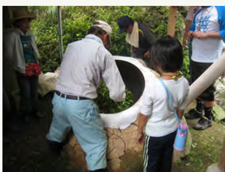
4. 茶釜で炒ると香ばしい香りが立つ