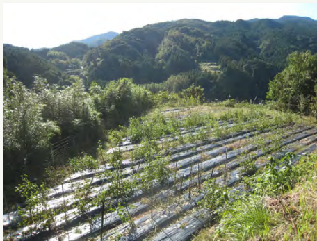
8. 収穫を迎えた和綿畑