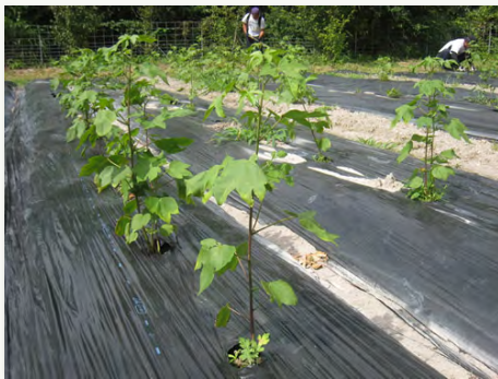
7. 順調に育つ (7/14)