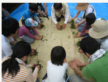
5. 炒った茶葉を手もみで仕上げる