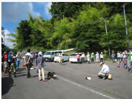
1. いつもの集合風景