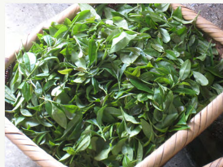
3. 摘んだばかりのキラキラした茶葉